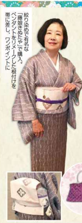
絞り染めで有名な「藤娘きぬたや」で購入。ペンダントをリメイクした根付けを帯に差し、ワンピースに

紋菓子の仲間には、雛祭が近づくとスーパーや和菓子店に桜餅が大量に並ぶようになる。今や当たり前になったこの光景は、私は小さな疑問符を感じている。「桃の節句と桜餅」が「端午の節句と柏餅」のようにセットになったのはいつ頃だろうか？ 幼い頃の記憶をたどると、雛祭に菱餅と雛あられは付き物だったが、桜餅は登場しなかった。もっとも、我家は伝統を忠実に守っていたわけではないから、よその家庭では普通に食べていたのを、知らなかっただけかも知れない。 桜餅も、私はずっと桜色のクレープで餡子を巻いた和菓子だと思っていたら、いつの間にか写真はあるけれど、この